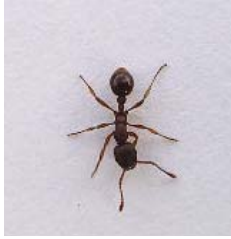
F O U R M I