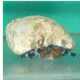
B E R N A R D L , E R M I T E