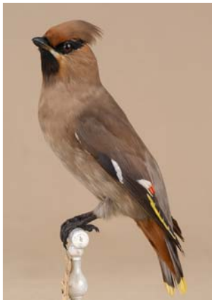
J A S E U R B O R É A L