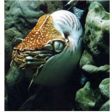
N A U T I L E