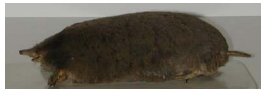
T A U P E

Dans le jardin, des petits tas de terre peuvent indiquer ma présence : T