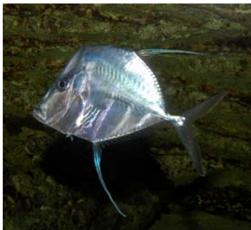
S É L È N E