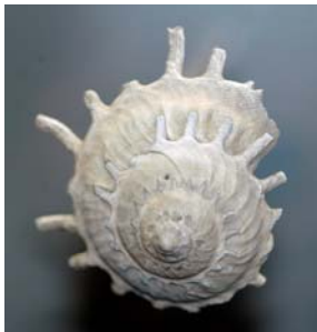
X É N O P H O R E S O L A I R E