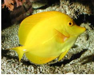
C H I R U R G I E N J A U N E