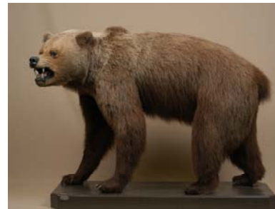
O U R S