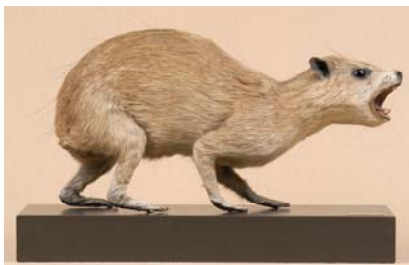
D A M A N D U C A P

Il manque un animal dont le nom commence par Y. Peux-tu en trouver un ?