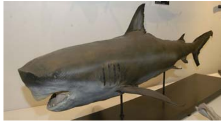
R E Q U I N