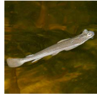
Q U A T R E Y E X