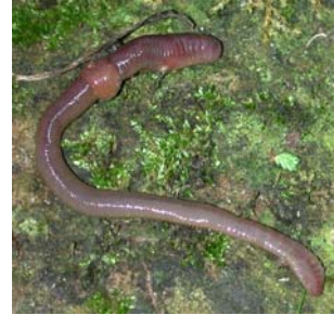
V E R D E T E R R E