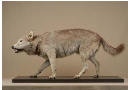
L O U P