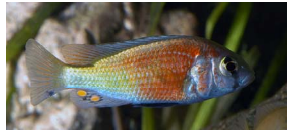
H A P L O C H R O M I S

Comme le médecin dont je porte le nom, je possède un scalpel. Ce dernier, situé sur ma queue me sert à me défendre : C