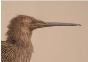
K I W I