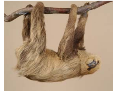
U N A U