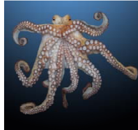
P I E U V R E