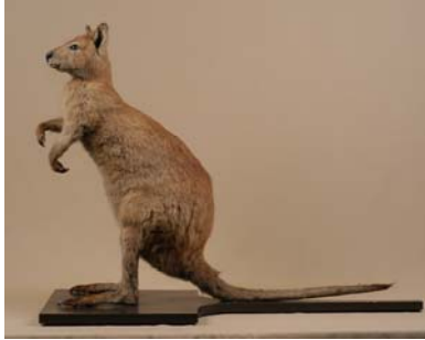
W A L L A B Y